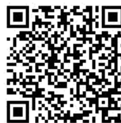
申込 QR コード

今回は、手の力が入りづらくなってきた時や片手が使えない時等に使用すると便利な「固定台」を製作します。身近にある安価な材料で作る自助具作りに参加しませんか。